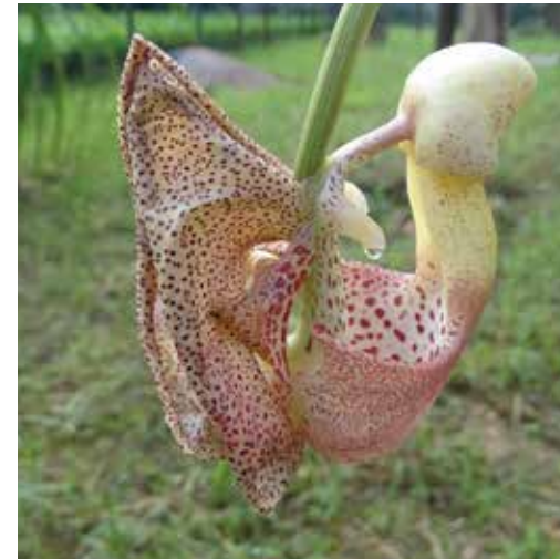
Nombre científico Coryanthes sp. Nombre común Orquídea Balde