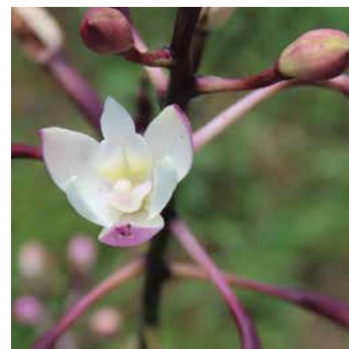
Nombre científico Caularthron bilamellatum Nombre común Orquídea Hormiguero