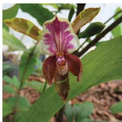
Nombre científico Aspasia epidendroides Nombre común Orquídea Amable