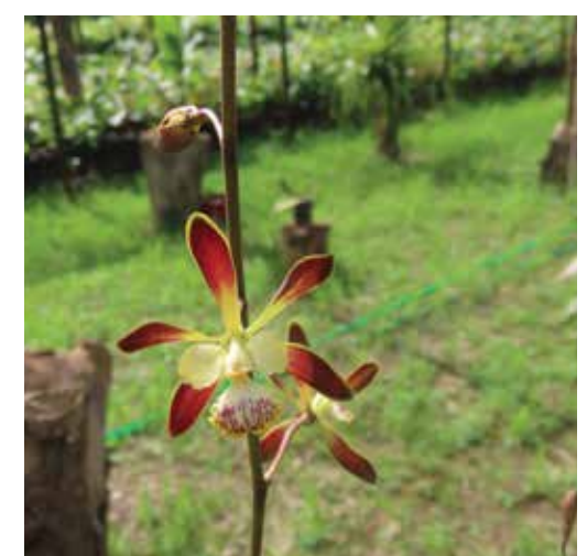
Nombre científico Encyclia alata Nombre común Orquídea Mariposa