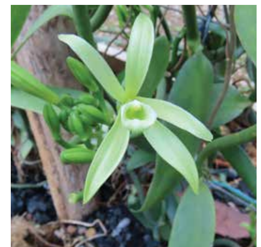
Nombre científico Vanilla planifolia Nombre común Vainilla