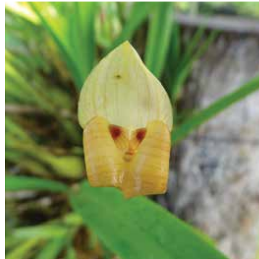
Nombre científico Trigonidium egertonianum Nombre común Orquídea Mascarita