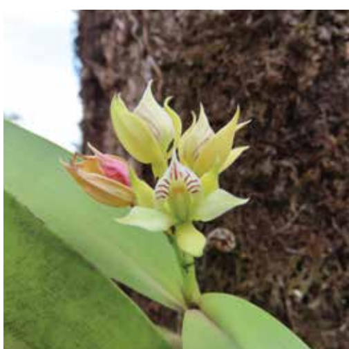
Nombre científico Prosthechea chacaoensis Nombre común Prostequia