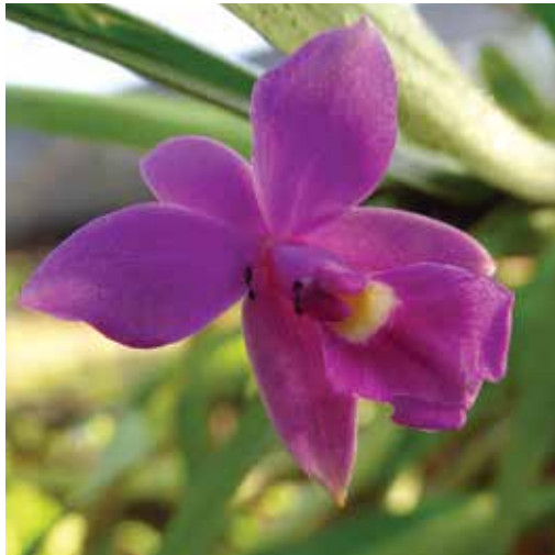
Nombre científico Dimerandra emarginata Nombre común Orquídea de la prosperidad