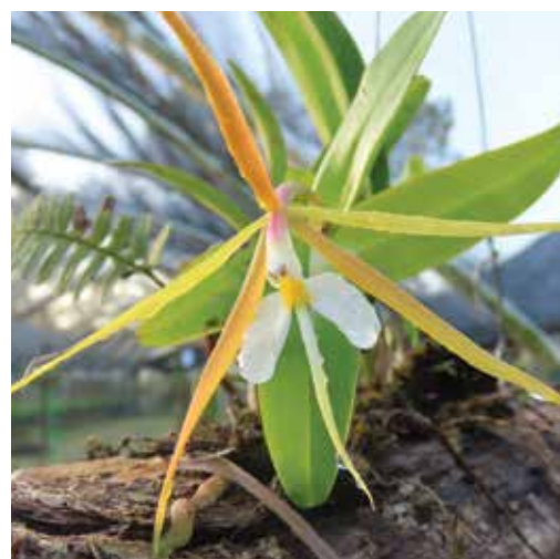
Nombre científico Epidendrum nocturnum Nombre común Dama de noche