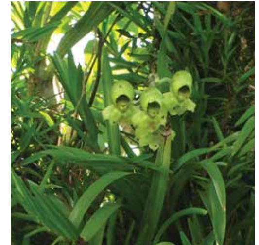
Nombre científico Catasetum maculatum Nombre común Orquídea Monge