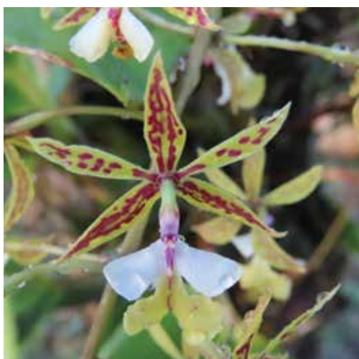
Nombre científico Epidendrum stamfordianum Nombre común Orquídea Tropical