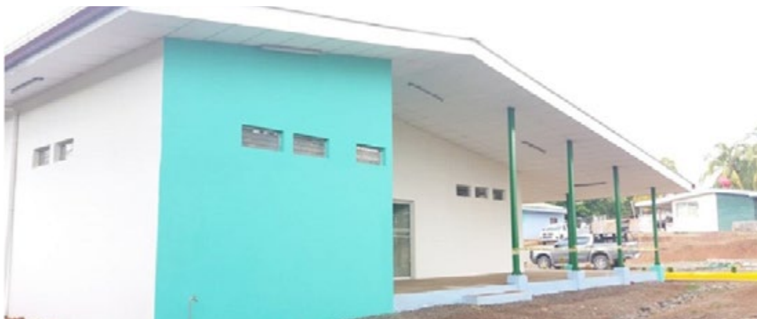
Ilustración 14: Centro de Salud, comunidad El Hormiguero.

Los casos graves se atienden en el Hospital Carlos Centeno de Siuna, el cual es una referencia en el Triángulo Minero. El hospital cuenta con una sala habilitada para la atención de casos de COVID-19 provenientes de la región, es decir: Siuna, Bonanza, Rosita y Mulukukú.