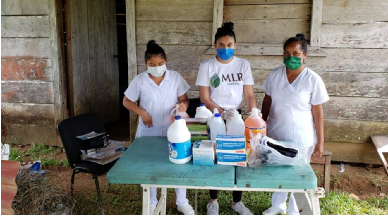
Ilustración 12: Personal del Centro de Salud de la Comunidad Unión Labú recibe kits de salud.

El Centro de salud de la Comunidad Unión Labú, no presenta condiciones para la atención primaria. La unidad cuenta con un médico y dos enfermeras que hacen su mejor esfuerzo para garantizar el apoyo en salud a la comunidad. A nivel del programa social de MLR, se valora acompañar mayor tiempo a esta unidad para que pueda brindar mejores acciones preventivas y detección temprana de casos para su remisión al hospital Carlos Centeno de Siuna.