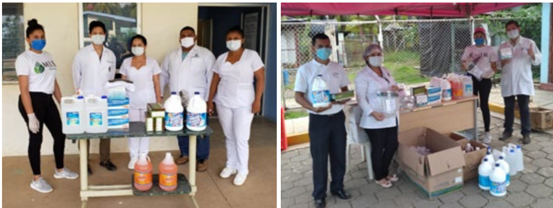
Ilustración 13: Entrega de kits de salud al personal del Centro de Salud El Hormiguero (izq). Personal del Hospital de Siuna (der).

Directora Hospital Carlos Centeno Municipio de Siuna