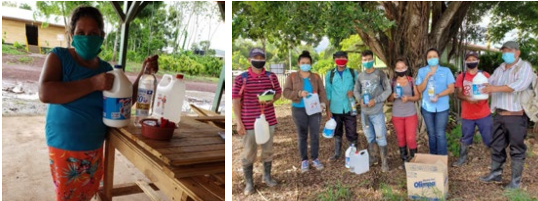
Ilustración 15: Trabajadores de diferentes áreas reciben kits de salud para sus familias.

Este componente es muy importante, ya que garantiza que dentro de la compañía no haya contagios masivos por hacinamiento, al establecer una cultura preventiva con el uso de EPP, lavado de manos, toma diaria de temperatura y capacitación constante.