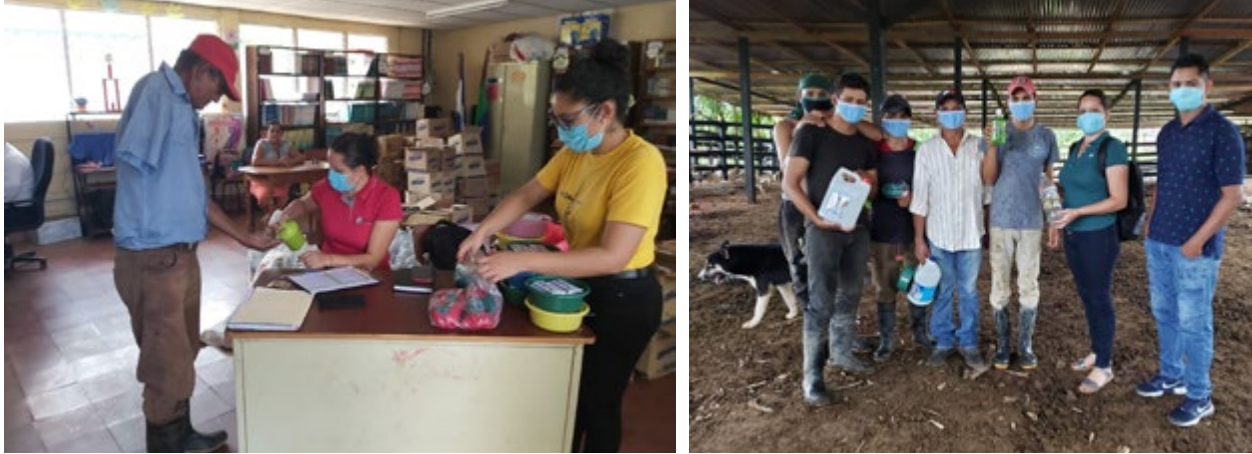
Ilustración 6: Medidas tomadas en la entrega de kits y verificación de uso de EPP.