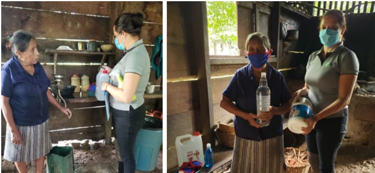
Ilustración 7: Pobladora en condiciones de pobreza, recibe kit de prevención.