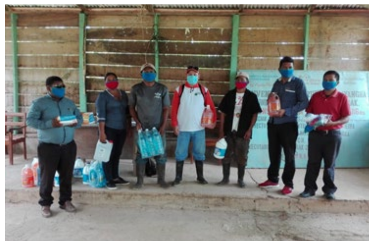
Ilustración 8: Autoridades comunales de Mukuswás y Españolina reciben kits de salud.