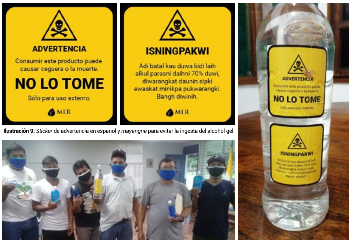
Ilustración 9: Sticker de advertencia en español y mayangna para evitar la ingesta del alcohol gel.

Para evitar la ingesta del alcohol de uso tópico exclusivo, se elaboraron mensajes en español y Mayangna para adherirse a las botellas de alcohol gel.