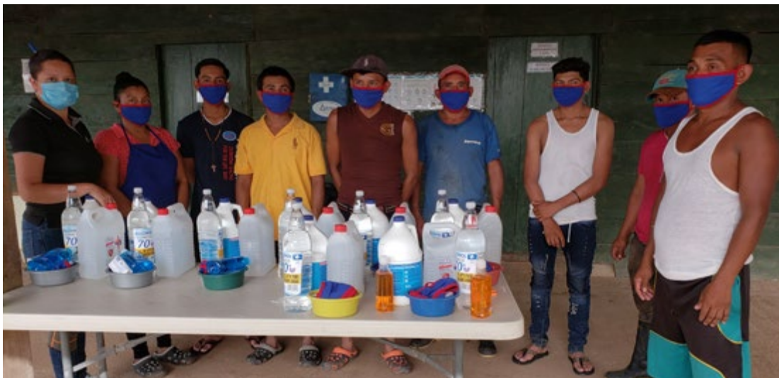
Ilustración 16: Trabajadores del campamento reciben kits de salud previo al retorno a sus hogares.