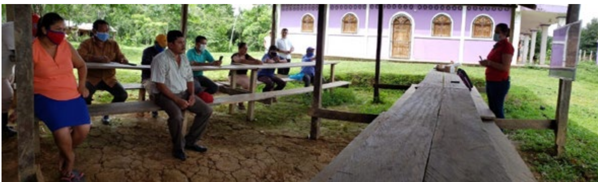
Ilustración 3: Asamblea de verificación de censo con líderes comunitarios de Unión Labú.

“Muchas gracias a MLR por tener la voluntad de apoyarnos en el cuidado de nuestra salud”.