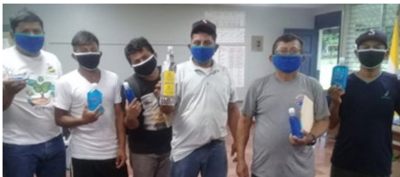
Ilustración 10: Stiker preventivos de "No beber" en español y mayangna adheridos a las botellas de alcohol.