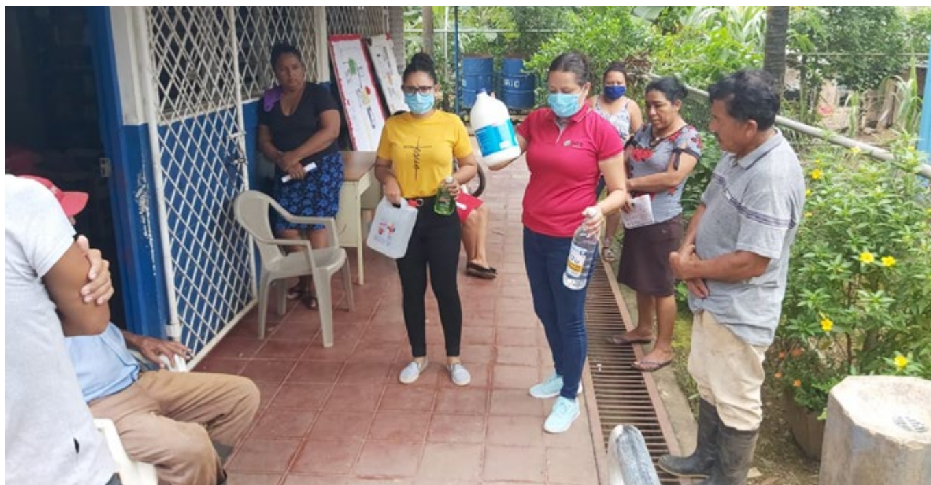
Ilustración 5: Capacitación y entrega de kits de salud a líderes comunitarios del Empalme Labú.